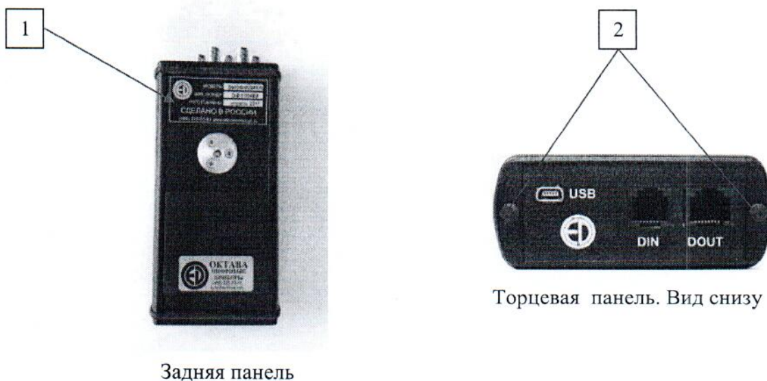
Рисунок 1 – Измеритель напряженности электрических и магнитных полей ПЗ-80