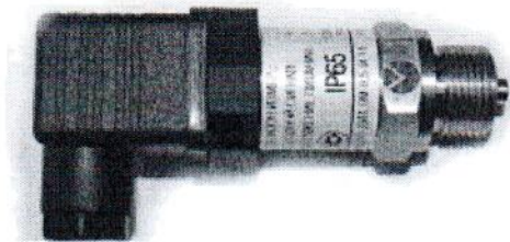
Рисунок 1-Общий вид преобразователей давления измерительных ОВЕН ПД100 -ДИ, -ДА, -ДВ (без встроенной индикации)