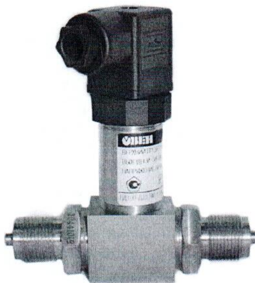
Рисунок 3- Общий вид преобразователей давления измерительных ОВЕН ПД100-ДД