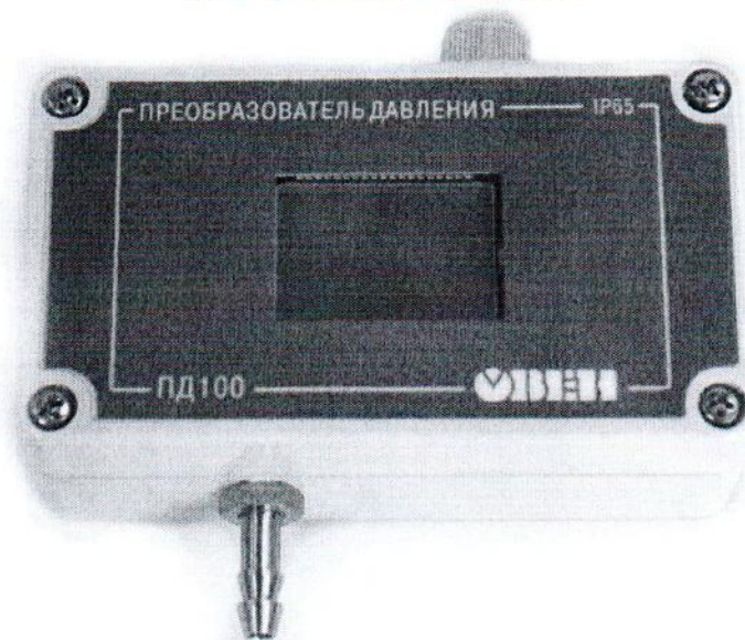
Рисунок 5- Общий вид преобразователей давления измерительных ОВЕН ПД100-ДИВ