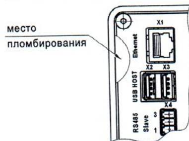
Рисунок 2 – Схема пломбировки от несанкционированного доступа