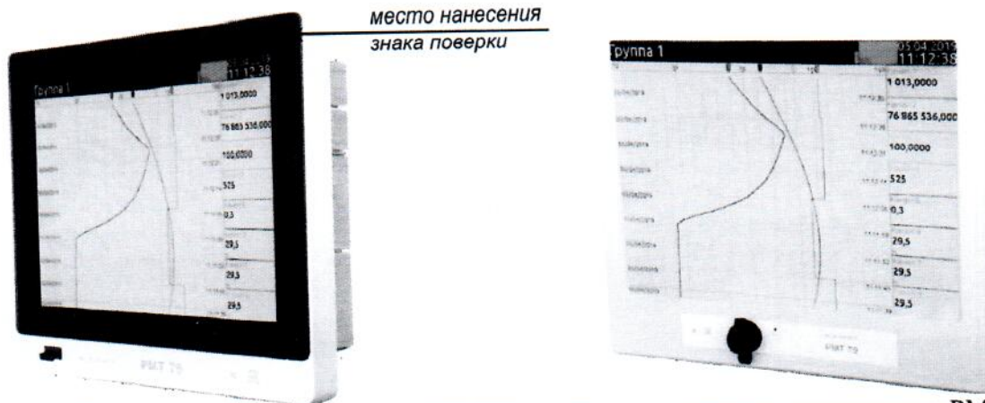
Рисунок 1 – Общий вид регистратора многоканального технологического РМТ 79 с размерами экрана 10 и 15 дюймов и обозначение места нанесения знака поверки

Схема пломбировки от несанкционированного доступа представлена на рисунке 2.