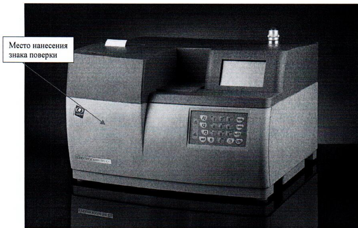
Рисунок 1 - Общий вид анализатора СПЕКТРОСКАН SW-D3