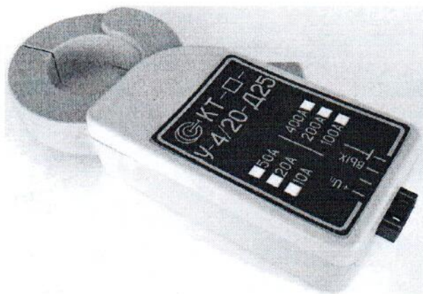
Рисунок 3 – Общий вид клещей токоизмерительных КТ-***-У-4/20-Д25