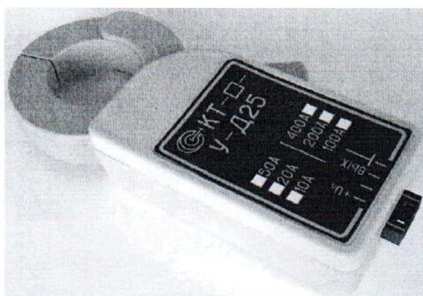
Рисунок 1 – Общий вид клещей токоизмерительных КТ-***-У-Д25

Пломбирование клещей токоизмерительных КТ не предусмотрено.