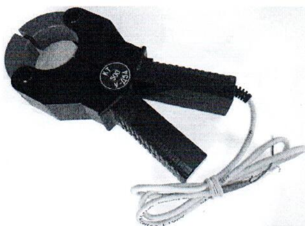
Рисунок 2 – Общий вид клещей токоизмерительных КТ-***-У-Д54