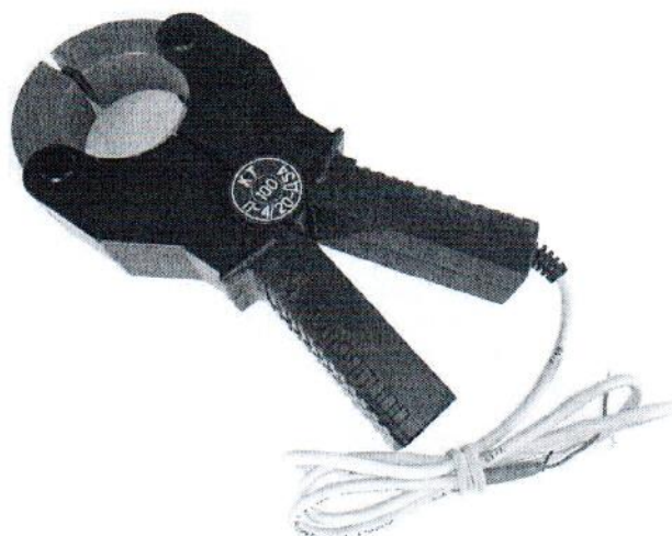
Рисунок 6 – Общий вид клещей токоизмерительных КТ-***-П-4/20-Д54