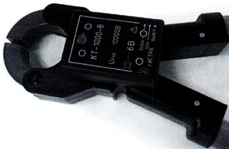
Рисунок 8 – Общий вид клещей токоизмерительных КТ-1000-В (без ручек)