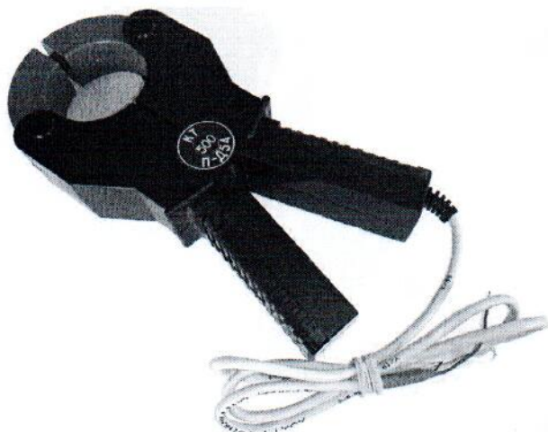
Рисунок 5 – Общий вид клещей токоизмерительных КТ-***-П-Д54