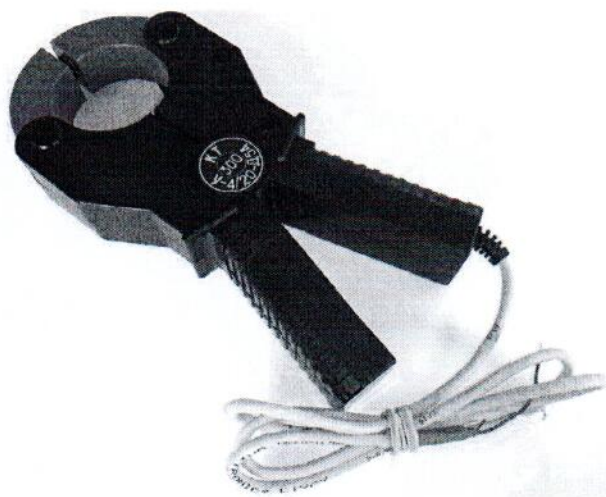
Рисунок 4 – Общий вид клещей токоизмерительных КТ-***-У-4/20-Д54