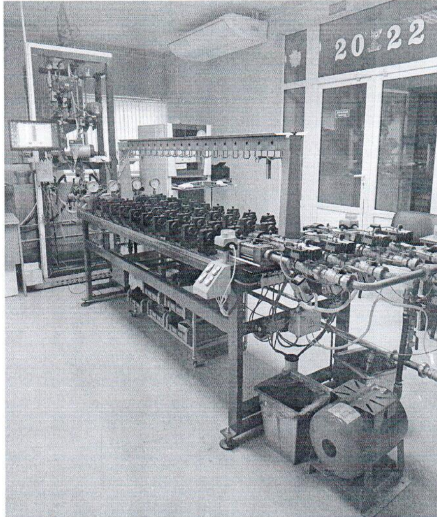
Рисунок 1- Фотография общего вида установки

Фотографии общего вида и маркировки единичного экземпляра средства измерений установки поверочной расходомерной Prematest 25 № 038/2012