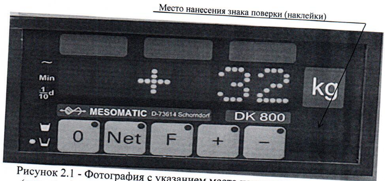
Рисунок 2.1 - Фотография с указанием места нанесения знака поверки (наклейки) на лицевую панель преобразователя весоизмерительного Mesomatic DK800.