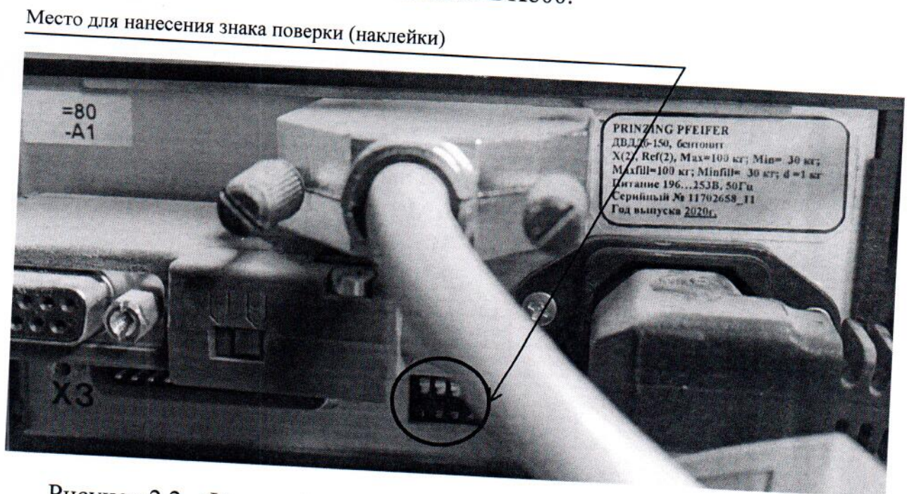
Рисунок 2.2 - Фотография с указанием места нанесения знака поверки (наклейки) на заднюю панель преобразователя весоизмерительного Mesomatic DK800.