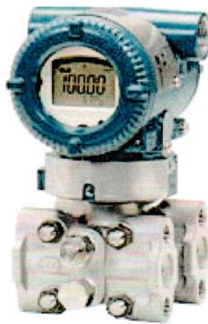
Рисунок А.2 – Общий вид преобразователя давления измерительного EJX110A