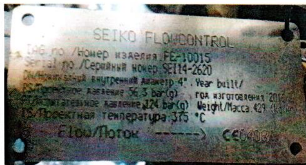
Рисунок А.3 – Маркировка клинового расходомера SEIKO № FE-10015