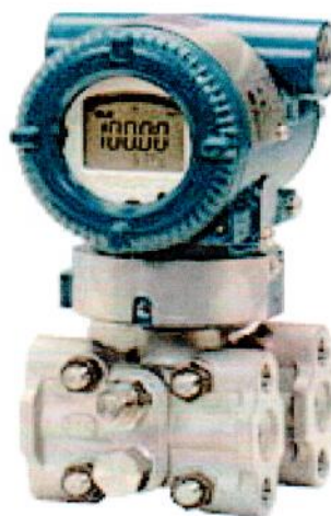
Рисунок А.2 – Общий вид преобразователя давления измерительного EJX110A