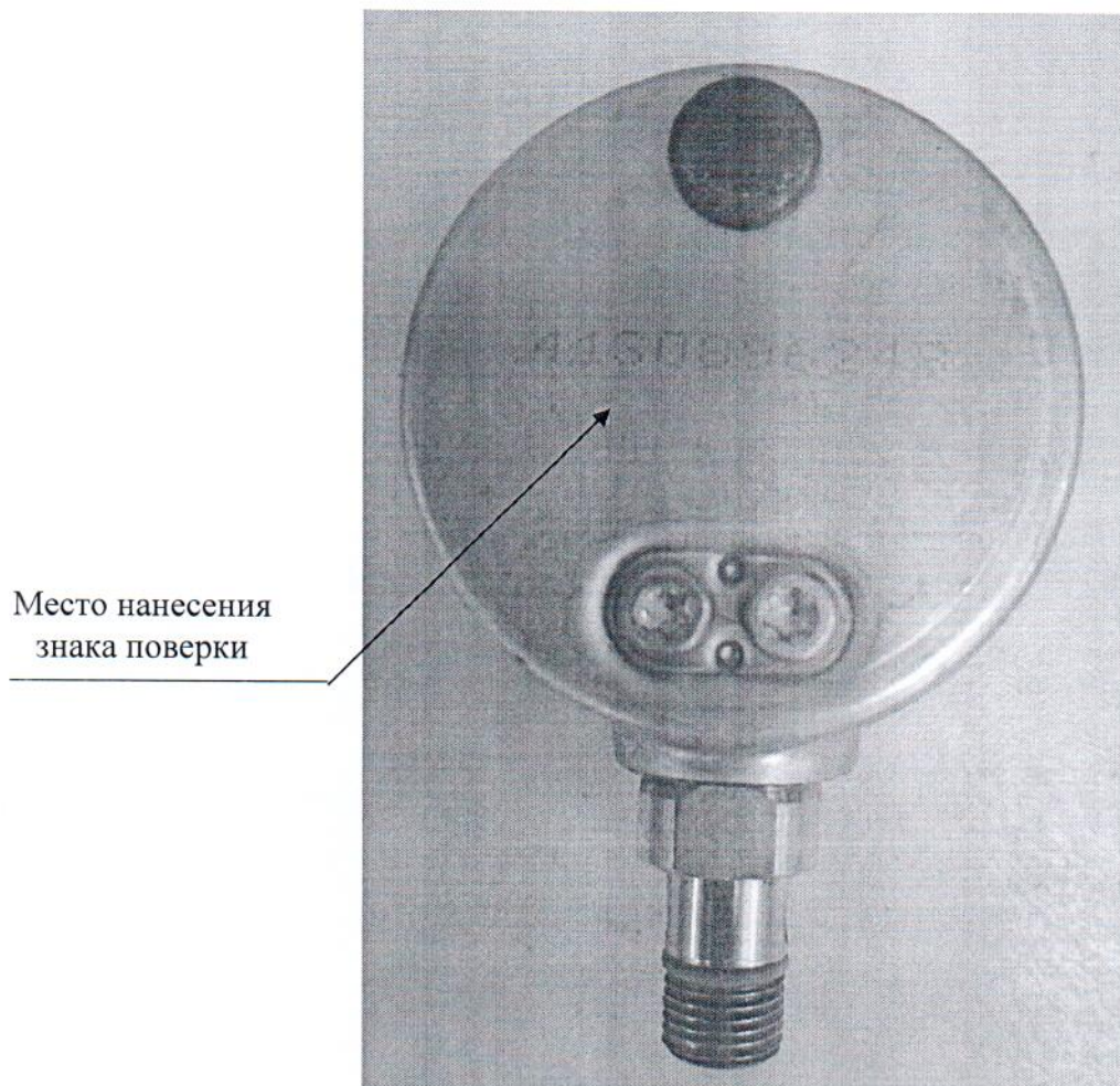
Рисунок 2 – Схема с указанием места нанесения знака поверки

Схема (рисунок) с указанием места нанесения знака поверки средств измерений