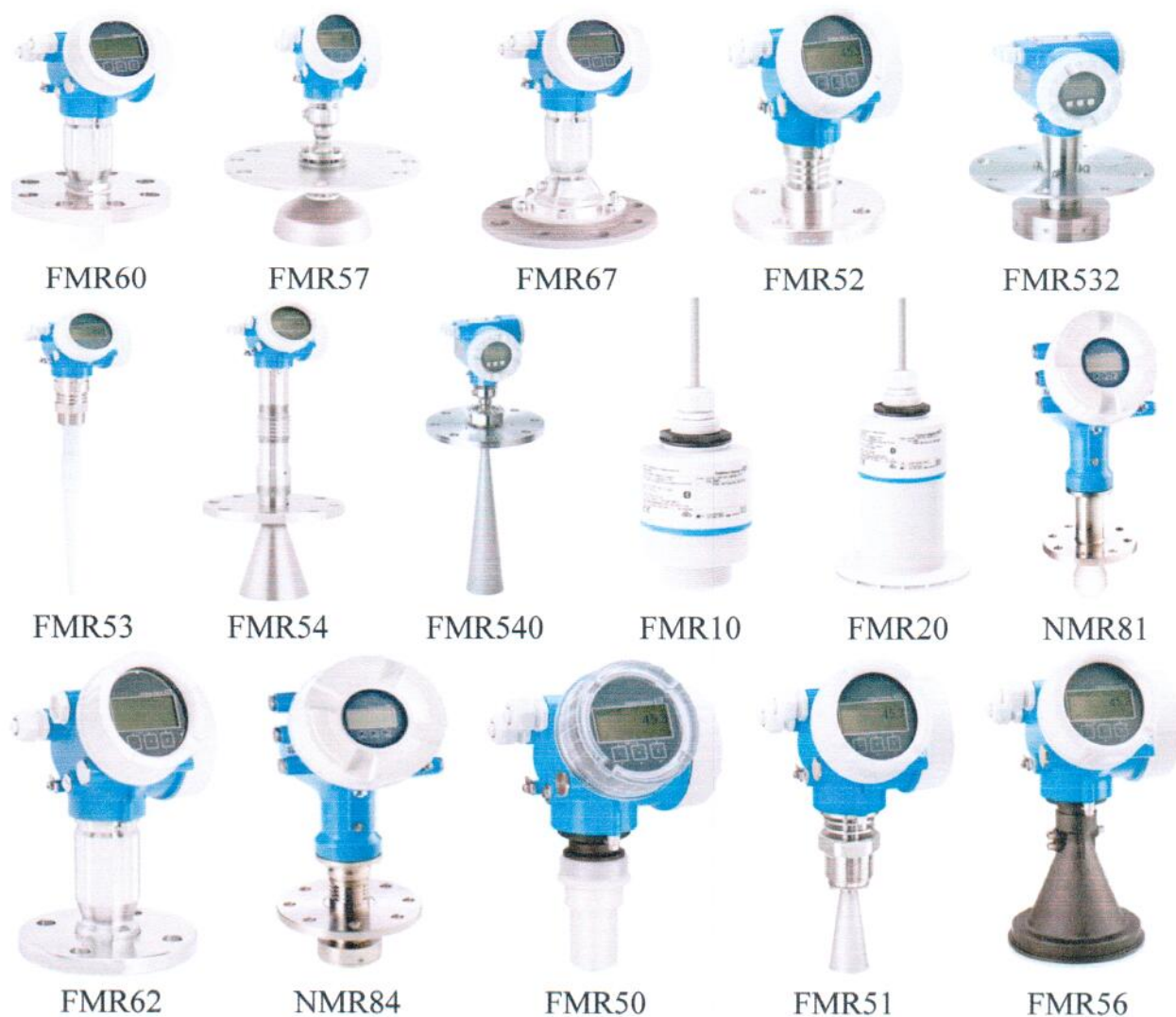
Рисунок 1.1 – Общий вид уровнемеров (фотографии носят иллюстративный характер)