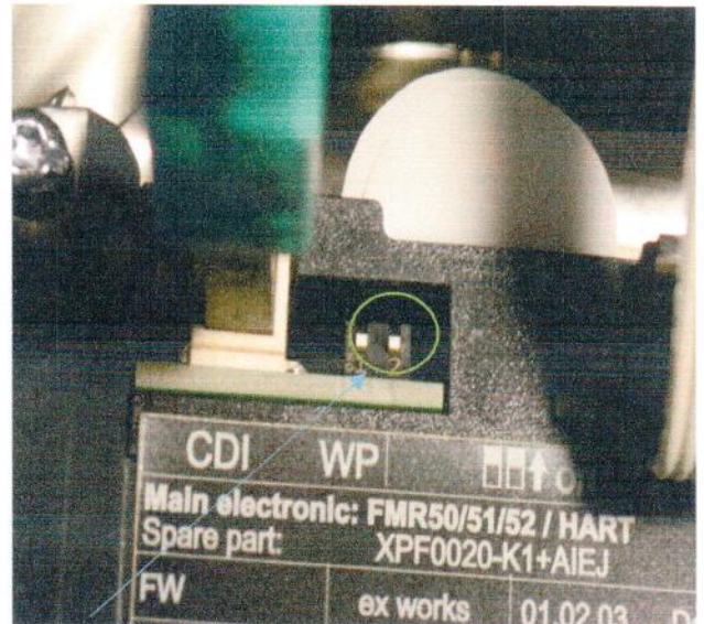
Переключатель блокировки настроек