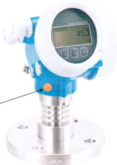
Рисунок 2.2 – Место для нанесения знака поверки (клейма-наклейки).

Место для нанесения знака поверки (клейма- наклейки)