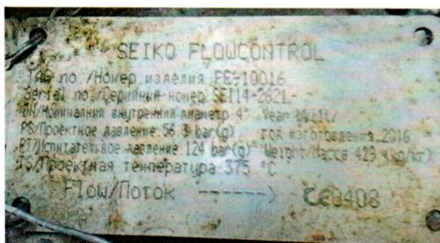
Рисунок А.3 – Маркировка клинового расходомера SEIKO № FE-10016