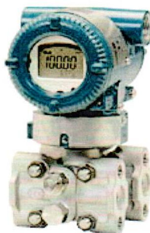
Рисунок А.2 – Общий вид преобразователя давления измерительного EJX110A