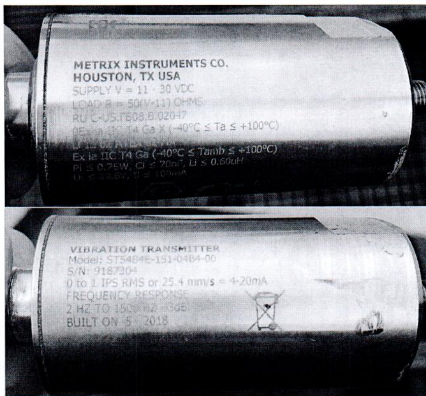
Рисунок 1.1 – Внешний вид и маркировка вибропреобразователя скорости ST5484E-151-04B4-00 № 9187304

Фотографии общего вида средства измерений