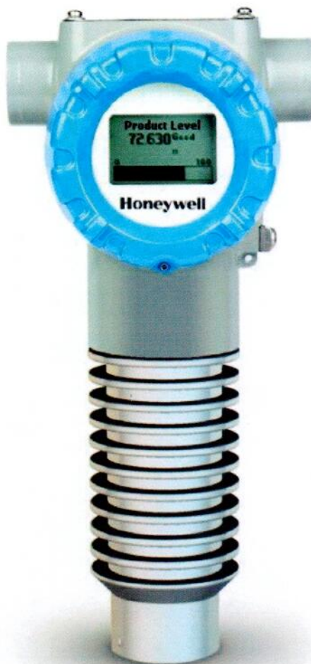
модуль электроники и модуль датчика уровнемеров

Фотографии общего вида средств измерений