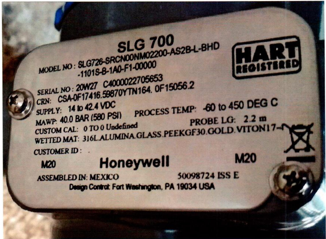
Рисунок 1.2 – Пример маркировки уровнемеров