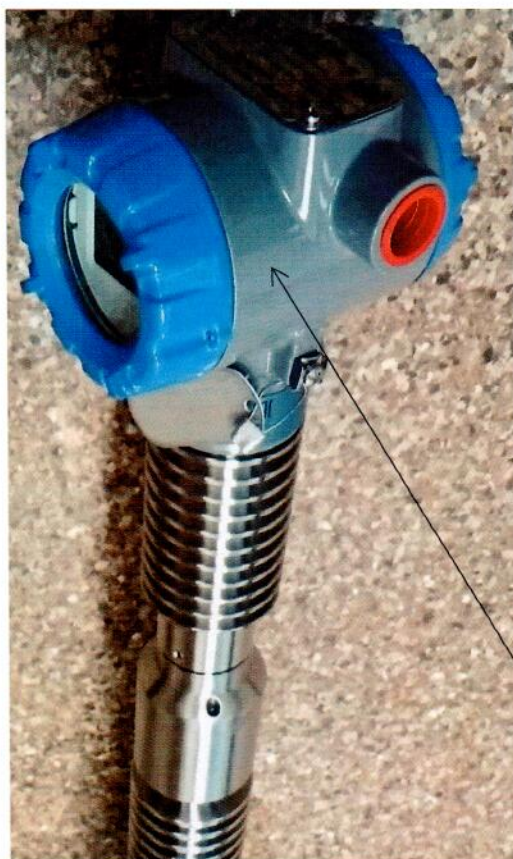
Схема с указанием места нанесения знака поверки средств измерений

Место нанесения знака поверки (клейма-наклейки)