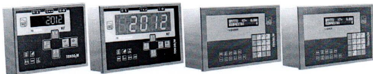
Рисунок 2 – Общий вид преобразователей