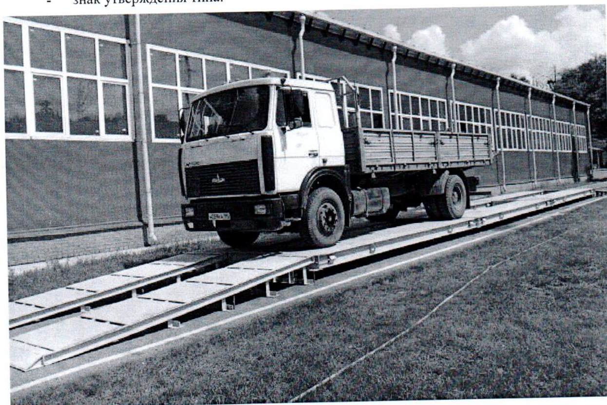
Рисунок 1 – Общий вид ГПУ