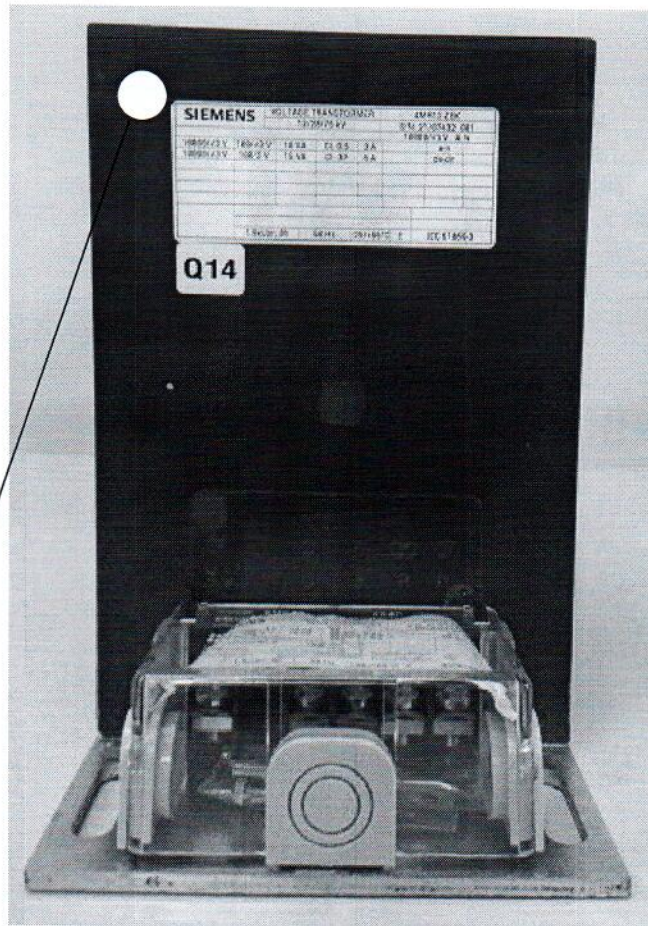
Схема с указанием места для нанесения знака поверки средств измерений

Места для нанесения знака поверки в виде клейма-наклейки