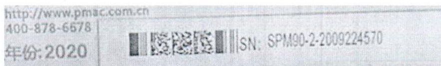
Рисунок 1.2 – Маркировка счетчика SPM90 зав. № SPM90-2-2009224570