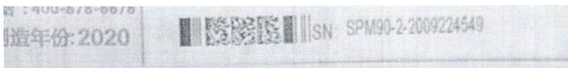
Рисунок 1.2 – Маркировка счетчика SPM90 зав. № SPM90-2-2009224549