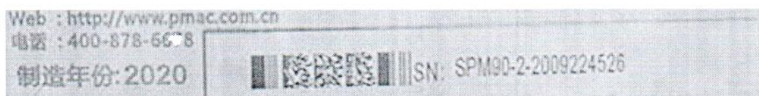
Рисунок 1.2 – Маркировка счетчика SPM90 зав. № SPM90-2-2009224526