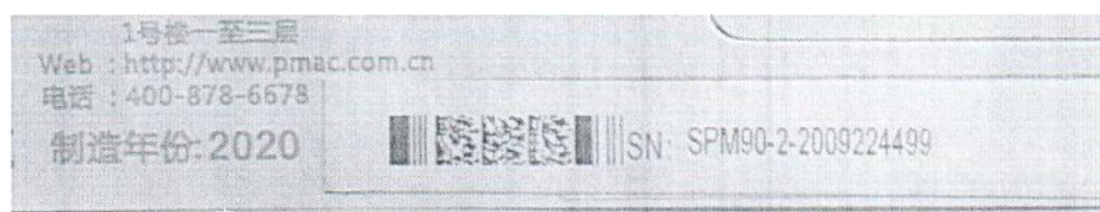
Рисунок 1.2 – Маркировка счетчика SPM90 зав. № SPM90-2-2009224499