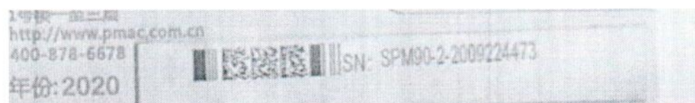
Рисунок 1.2 – Маркировка счетчика SPM90 зав. № SPM90-2-2009224473