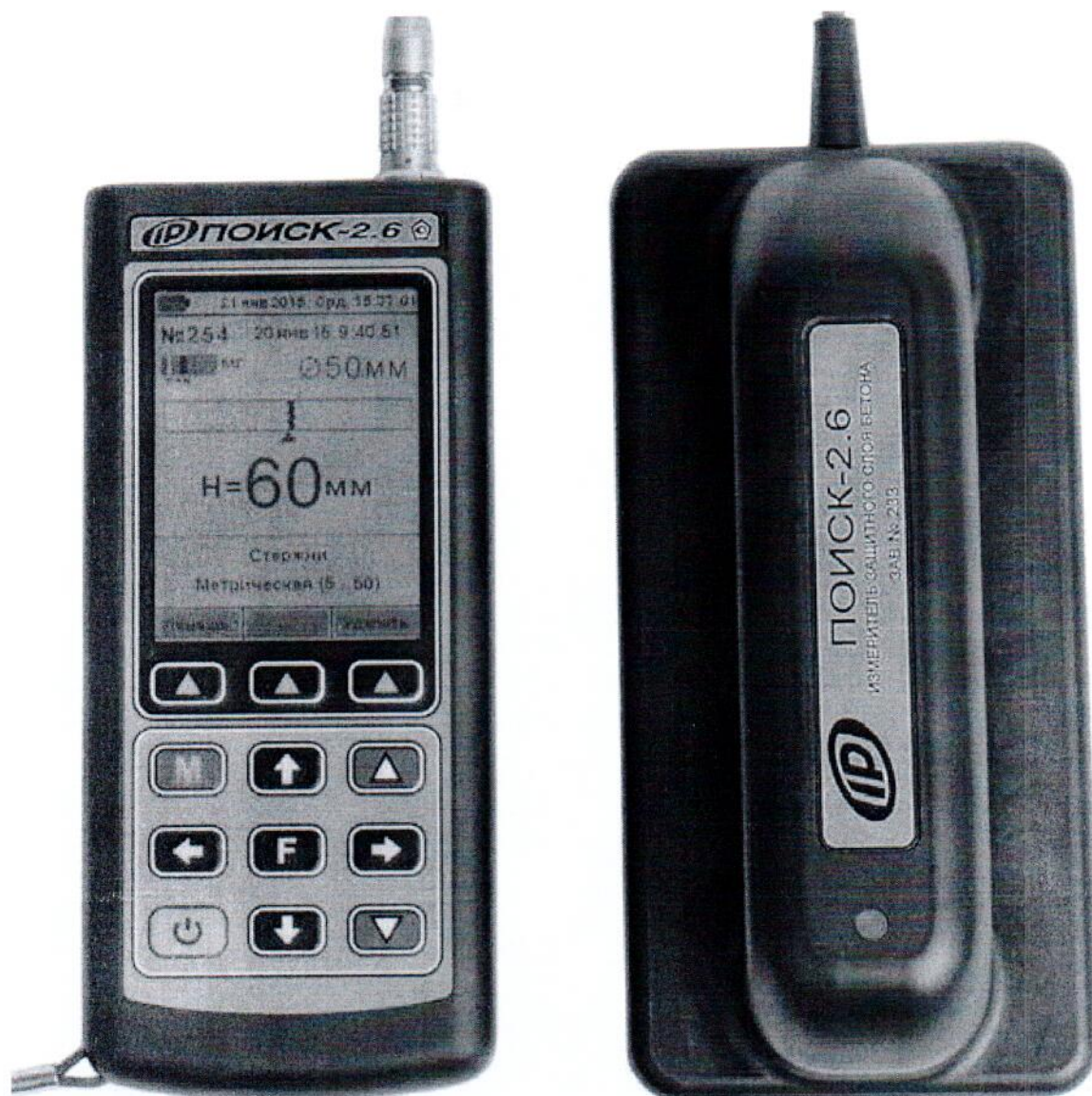
Рисунок 4 – Общий вид прибора модификации Поиск-2.6