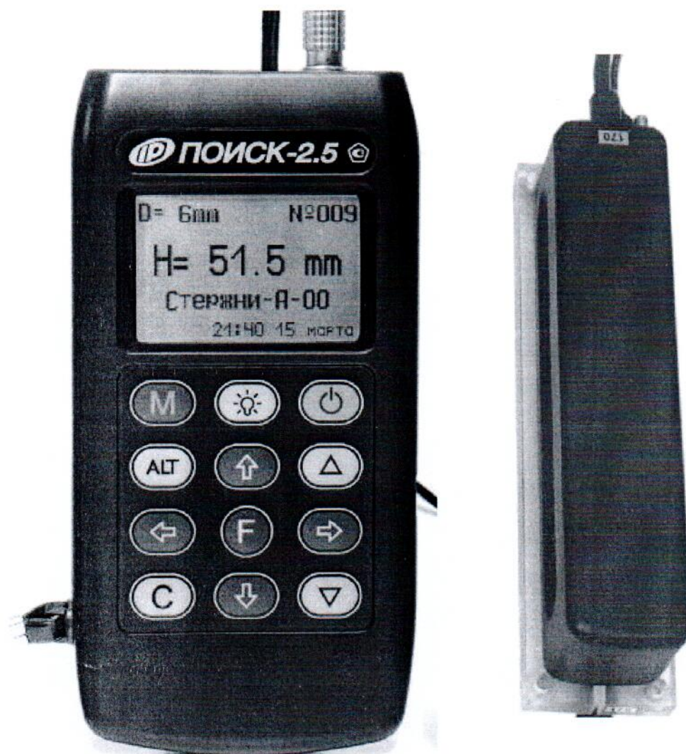
Рисунок 3 – Общий вид прибора модификации Поиск-2.5