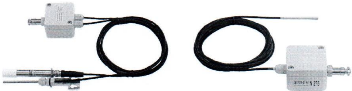
Рисунок 4 – Общий вид преобразователей исполнения 5Т-5П-АК (слева) и 5Т-АК (справа, исполнение без канала измерения относительной влажности)