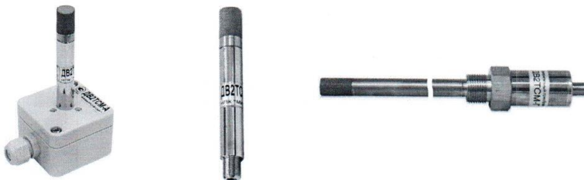
Рисунок 1 – Общий вид преобразователей исполнений ДВ2ТС(М)-А\080 (слева), ДВ2ТСМ-Б\080 (в центре), ДВ2ТС(М)-ГМ (справа)

Конструкция преобразователей не имеет предусмотренных мест для установки пломб. Общий вид преобразователей различных исполнений представлен на рисунках 1 – 6.