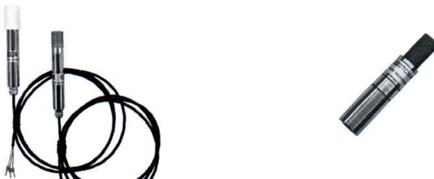
Рисунок 6 – Общий вид преобразователей исполнения ДВ2М-Б (слева) и ДВ2ТСМ-Р-Б (справа)