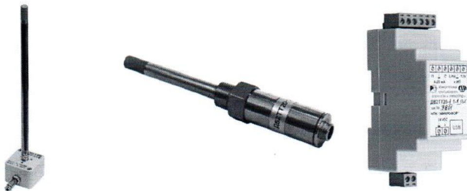
Рисунок 5 – Общий вид преобразователей исполнений ДВ2ТТ20-А (слева), ДВ2ТТ20-ГМ (в центре) и преобразователя интерфейса, входящего в состав преобразователей исполнения ДВ2ТТ20-Г (справа)