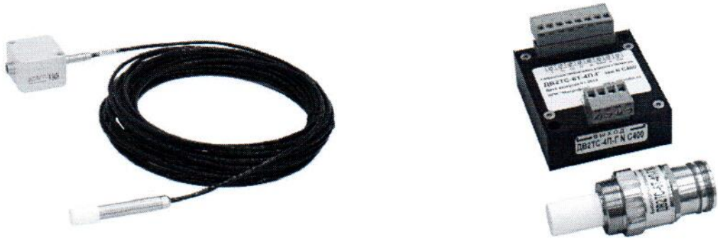
Рисунок 2 – Общий вид преобразователей в исполнении Г (справа – исполнение 6Т-Г)