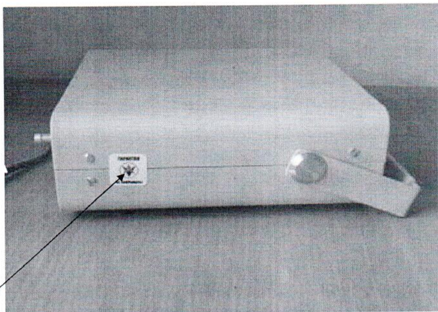
Рисунок 2 - Место нанесения саморазрушающейся наклейки на корпус барометра БРС-1М