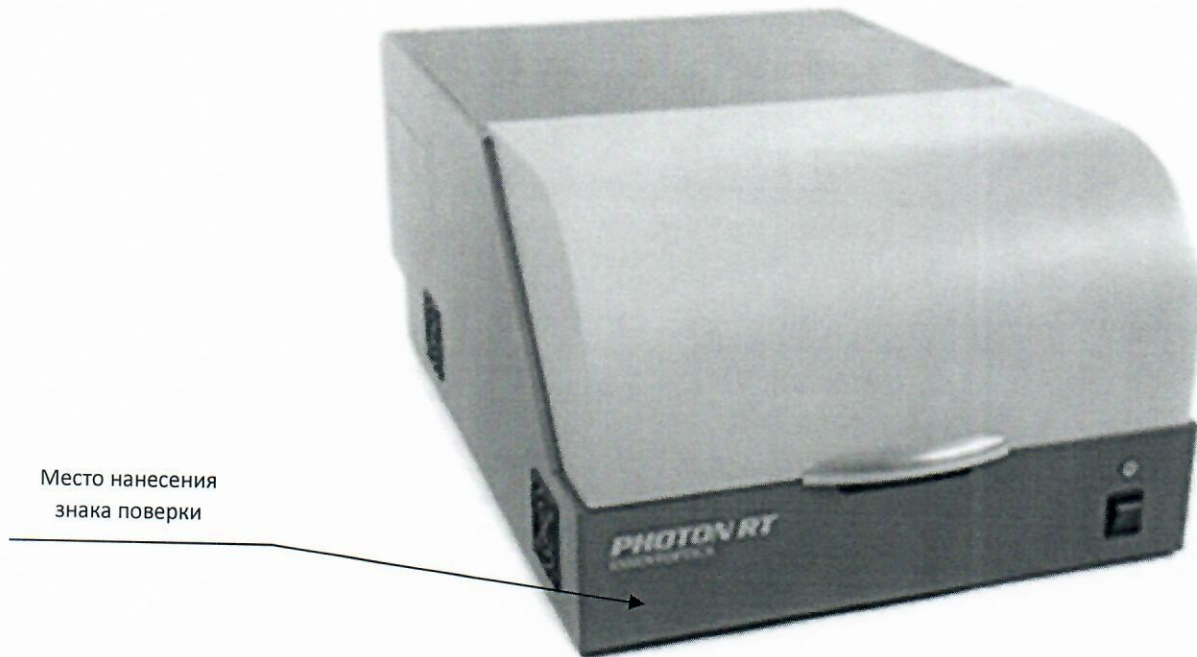
Рисунок 1 - Место нанесения знака поверки в виде клейма-наклейки

Схема с указанием места нанесения знака поверки (клеймо-наклейка)