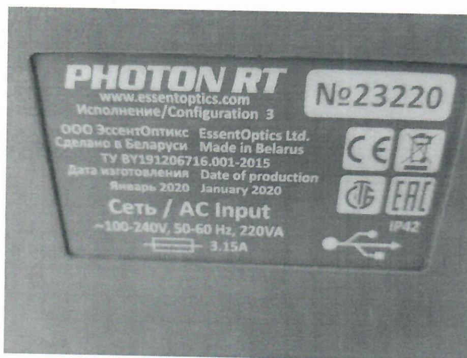
Рисунок 2 – Маркировка спектрофотометров PHOTON RT