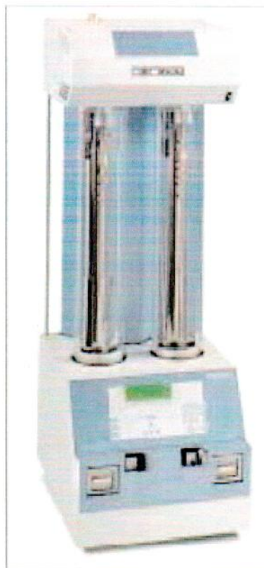
Рисунок А.1 – Общий вид анализатора