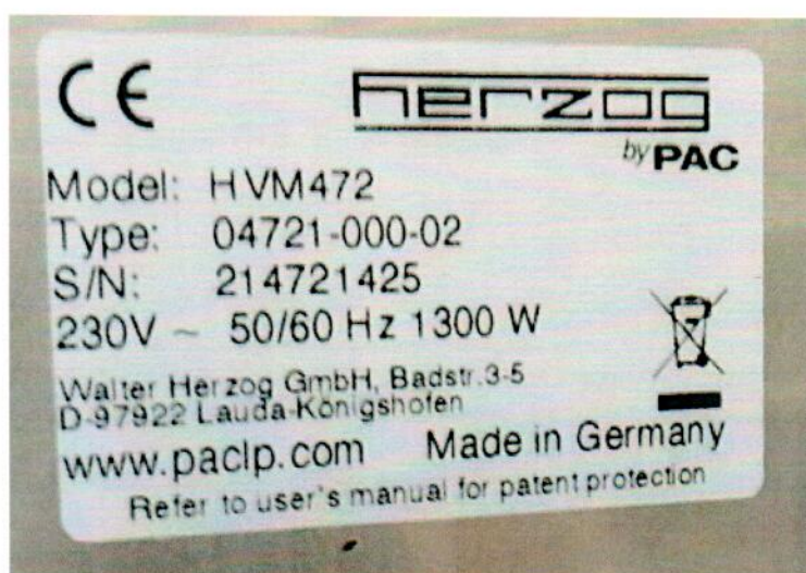
Рисунок А.2 – Образец маркировки анализатора