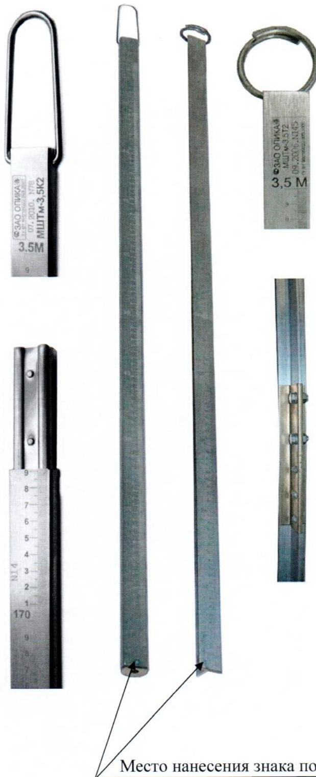
Рисунок Б.1 – Место нанесения знака поверки в виде клейма-наклейки

Схема с указанием места нанесения знака поверки в виде клейма-наклейки.