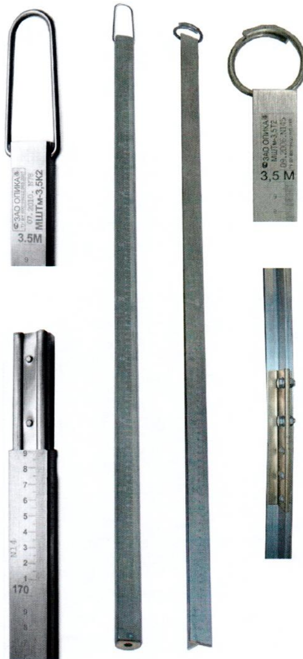
Рисунок А.1 – Внешний вид метроштоков

Фотографии общего вида средства измерений