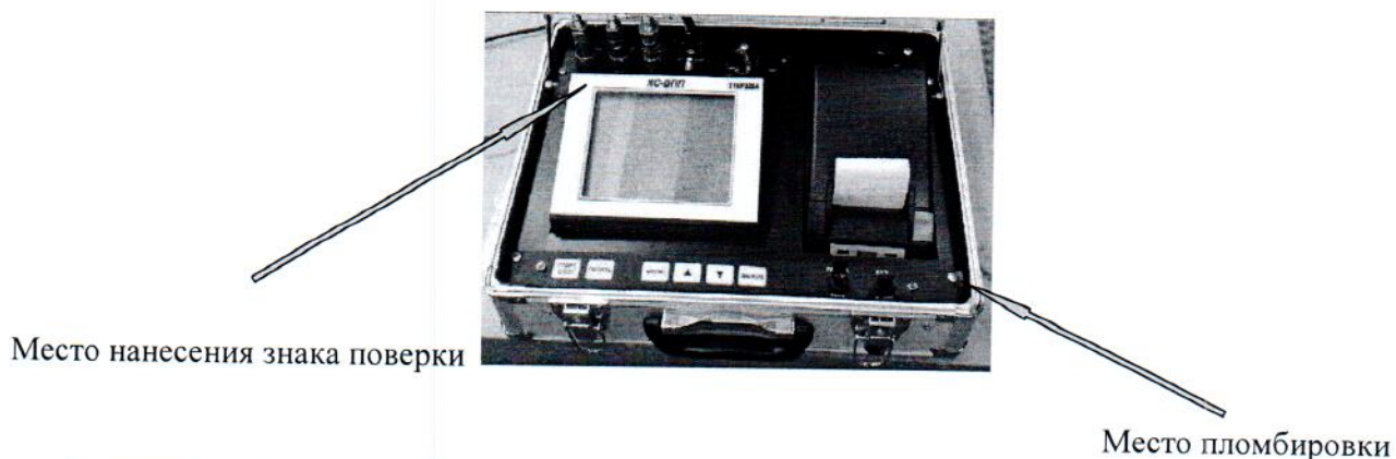
Рисунок 2 – Схема пломбировки от несанкционированного доступа и обозначение места нанесения знака поверки.