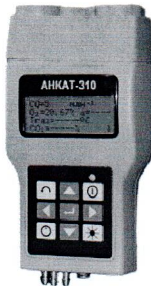
Рисунок 1 - Внешний вид газоанализаторов АНКАТ-310