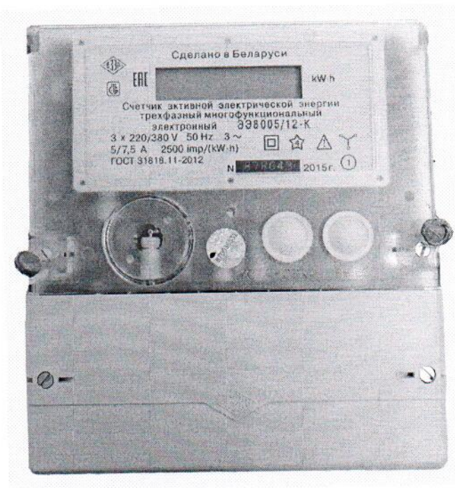
Рисунок 1.1б – Общий вид счетчика ЭЭ8005-К