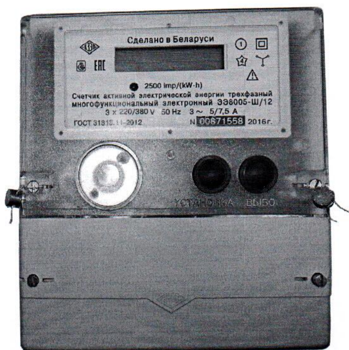
Рисунок 1.1в – Общий вид счетчика ЭЭ8005-Ш