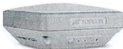
Topcon Hiper SR