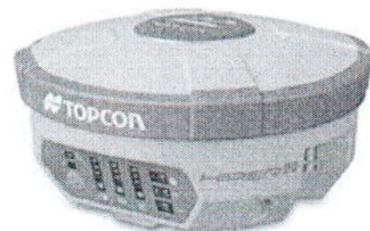
Topcon Hiper V