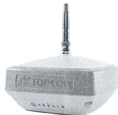
Topcon Hiper VR