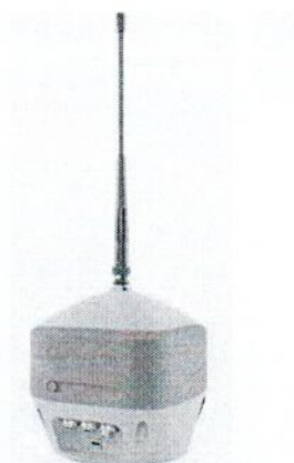
Topcon Hiper HR