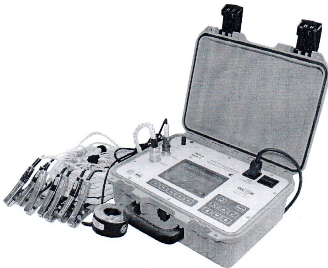
Рис. 2 Измерительный блок