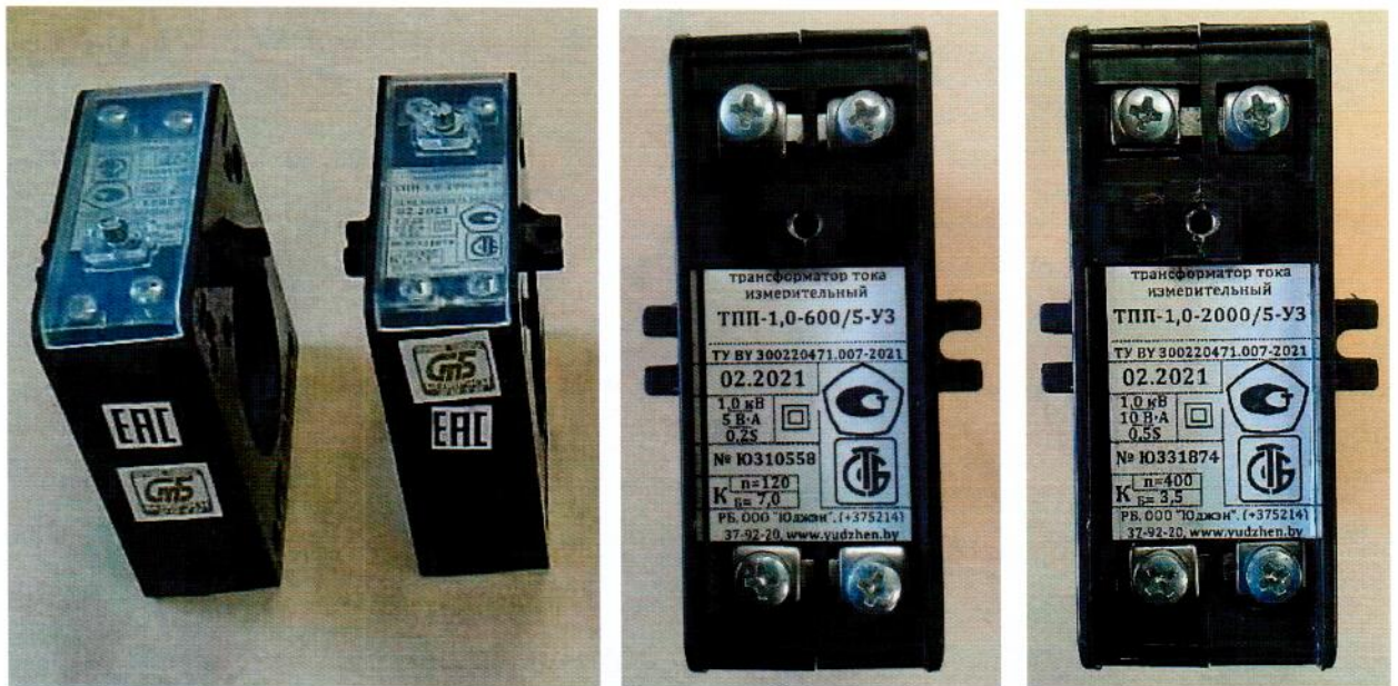
Рисунок А.2 – Внешний вид и образец маркировки трансформаторов тока ТТП и ТТП-Н