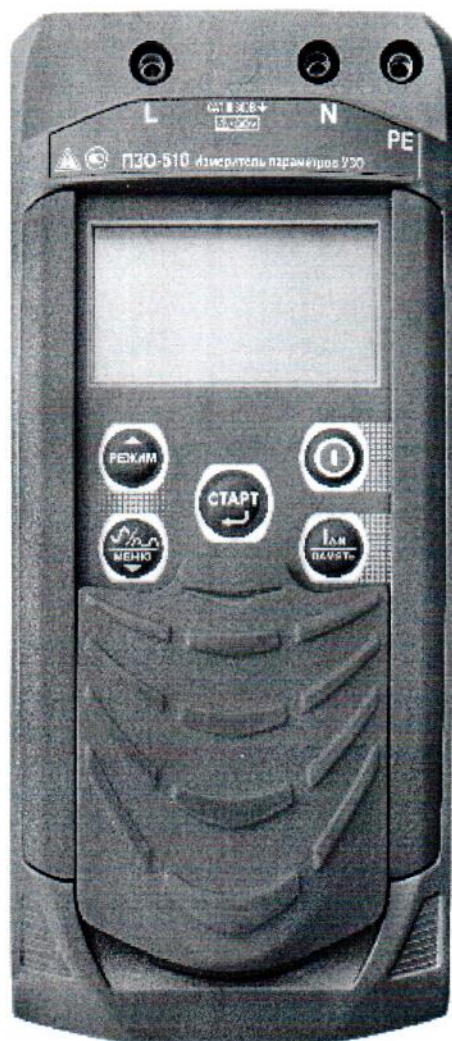
Рисунок 1 – Общий вид измерителей параметров УЗО ПЗО-510. Вид спереди

Общий вид приборов представлен на рисунках 1 – 4. Схема пломбировки от несанкционированного доступа представлена на рисунке 5.