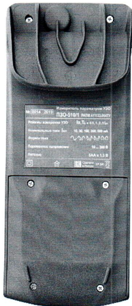
Рисунок 4 – Общий вид измерителей параметров УЗО ПЗО-510/1. Вид сзади