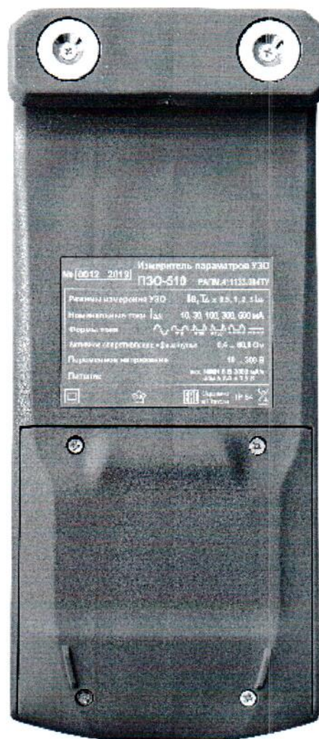
Рисунок 2 – Общий вид измерителей параметров УЗО ПЗО-510. Вид сзади