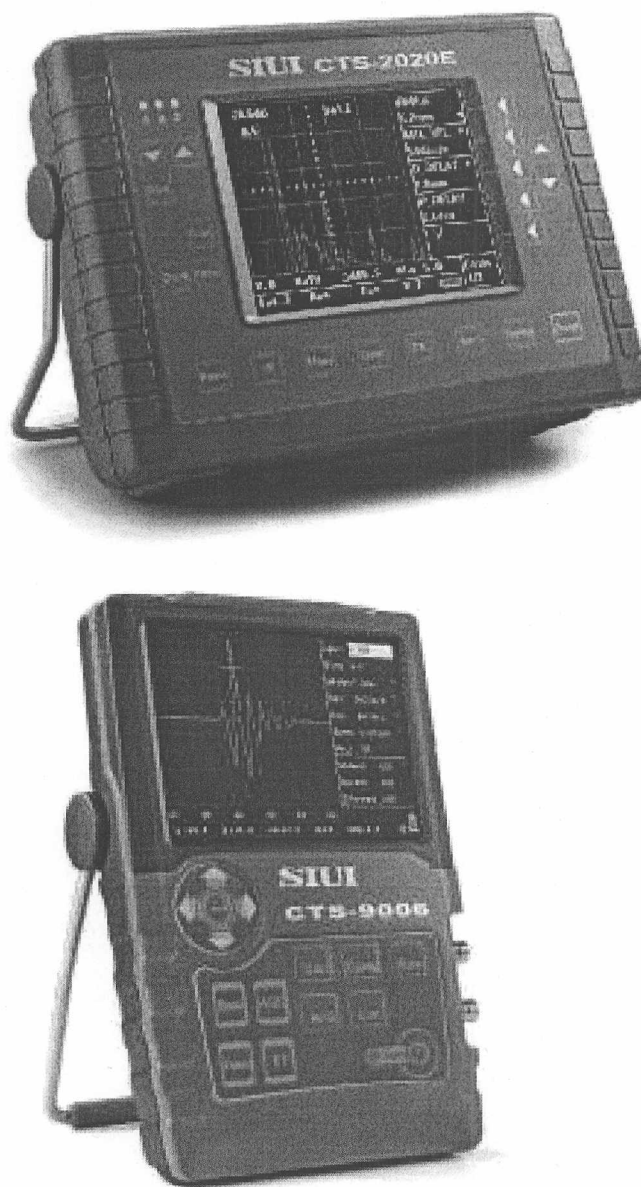
Рис. 1 Внешний вид дефектоскопов

Внешний вид дефектоскопов приведен на рисунке 1.