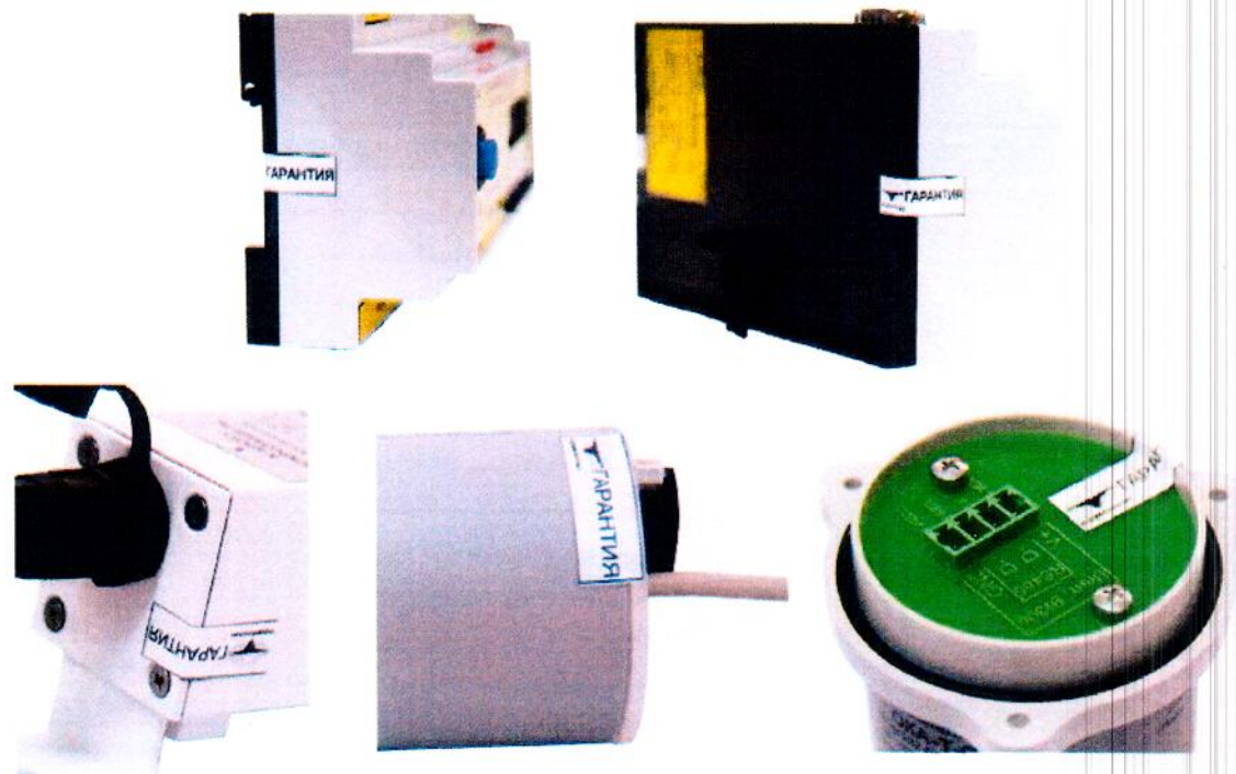
Рисунок 10 - Места пломбировки газоанализаторов и блоков