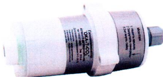
Рисунок 3 - Внешний вид стационарного газоанализатора со встроенным блоком датчика без взрывозащиты