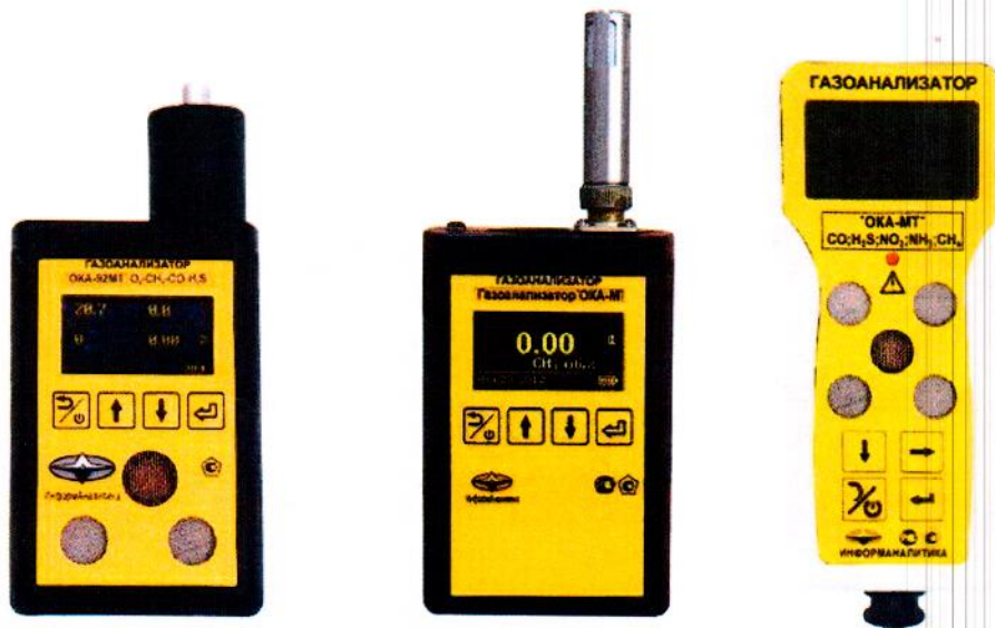
Рисунок 1 - Внешний вид газоанализаторов переносных со встроенным блоком датчиков без взрывозащиты

Внешний вид газоанализаторов и отдельных блоков представлен на рисунках 1 - 9.