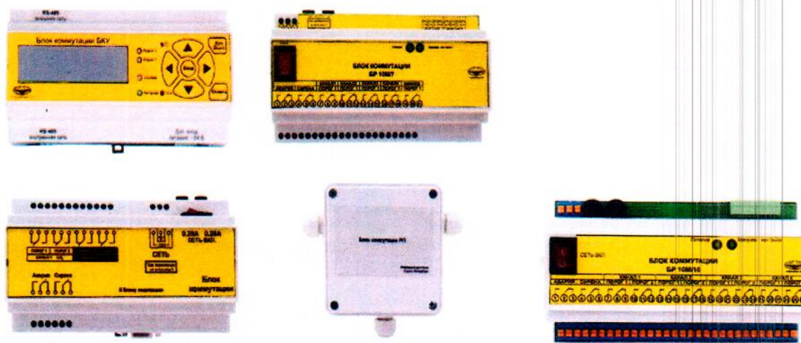
Рисунок 7 - Внешний вид блоков коммутации стационарных газоанализаторов с выносными блоками датчиков