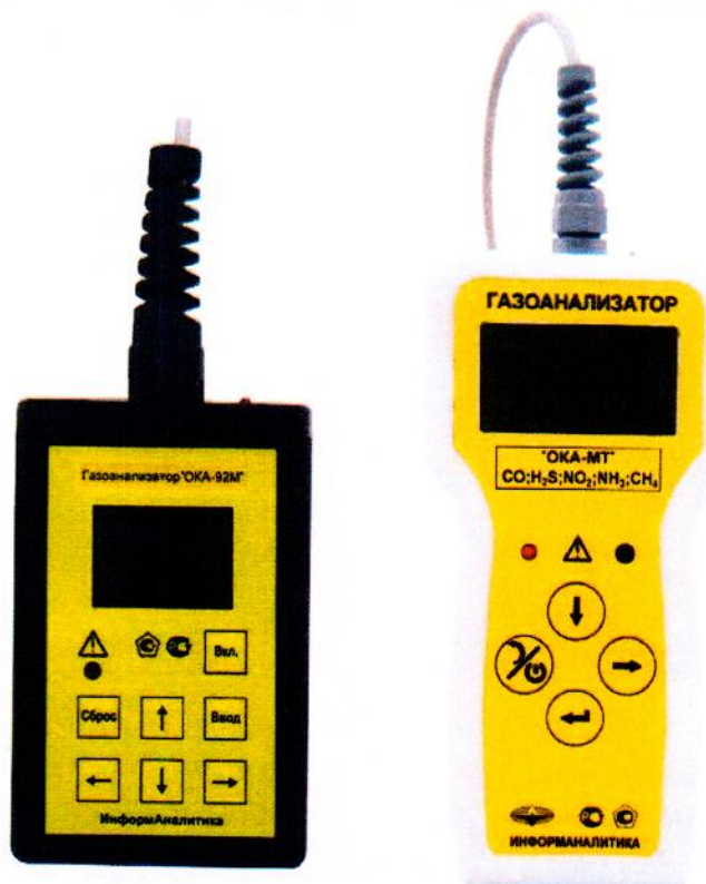
Рисунок 5 - Внешний вид блоков индикации переносных газоанализаторов с выносным блоком датчиков без взрывозащиты