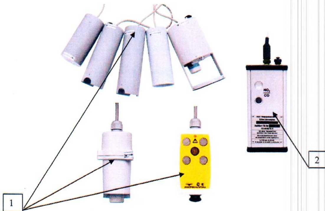
Рисунок 9 - Внешний вид выносных блоков датчиков переносных газоанализаторов: