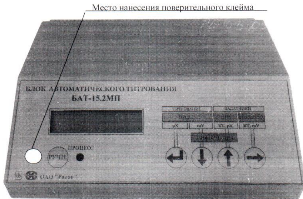
Рисунок 1 – Общий вид прибора

Пломбирование от несанкционированного доступа производится заливкой пломбировочной мастики по 5M0.050.122 ТИ одного из винтов, соединяющих крышку с основанием корпуса, расположенного на нижней крышке прибора, с последующим нанесением оттиска поверительного клейма (рисунок 2). На лицевую панель прибора наносится клеймо – наклейка (рисунок 1), в эксплуатационном документе оттиск поверительного клейма.