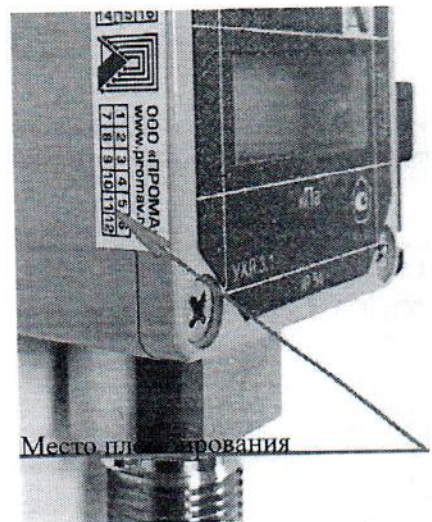
Рисунок 2 - Места пломбирования датчиков