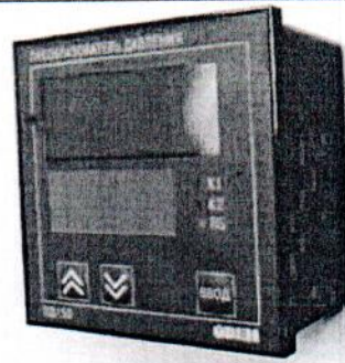
Рисунок 2 - Общий вид преобразователей ПД150 ДА (ДИ, ДВ, ДИВ, ДД) в щитовом исполнении