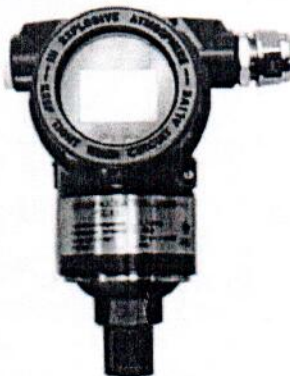
Рисунок 5 - Общий вид преобразователей ПД150 ДА (ДИ, ДВ, ДИВ) в полевом исполнении