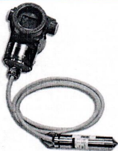
Рисунок 3 - Общий вид преобразователей ПД150 ДГ в полевом исполнении