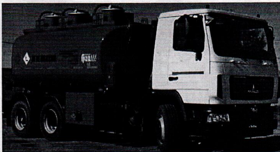
Рисунок 1 - Общий вид автоцистерны ГАЗ-АТЗ-15,0