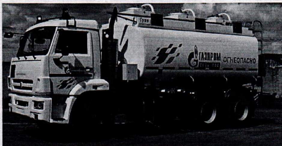
Рисунок 2 - Общий вид автотопливозаправщика ГАЗ-АЦ-17,0

На боковых сторонах и сзади АЦ и АТЗ имеют надпись «ОГНЕОПАСНО», знак ограничения скорости и знаки с информационными табличками для обозначения транспортного средства, перевозящего опасный груз.