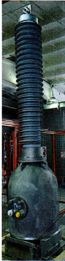
Рисунок 1 - Общий вид трансформаторов

Общий вид трансформаторов представлен на рисунке 1, общий вид клеммной коробки с обозначением места пломбирования от несанкционированного доступа представлен на рисунке 2.