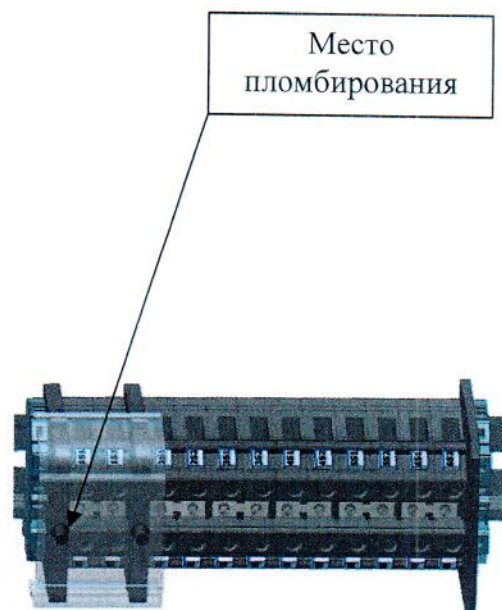
Рисунок 2 - Место пломбирования клемм от несанкционированного доступа