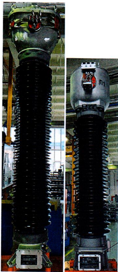
Рисунок 1 - Общий вид трансформаторов тока серии TG