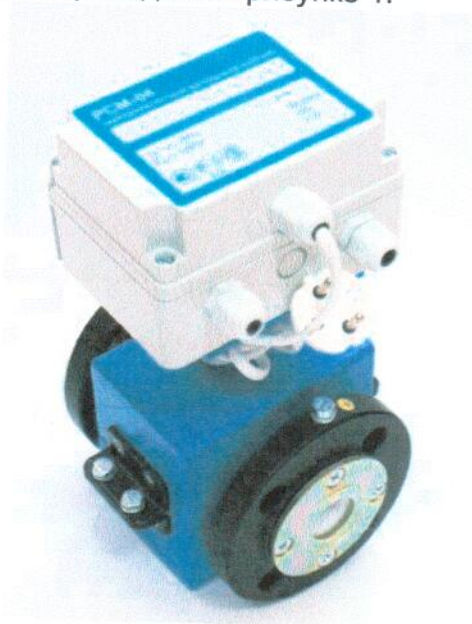
Рисунок 1. Внешний вид расходомеров

Внешний вид расходомеров приведен на рисунке 1.