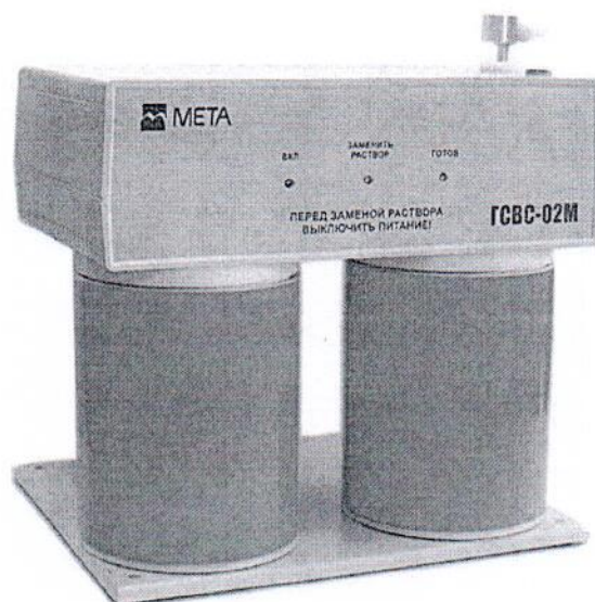
Рисунок 2 – Внешний вид генераторов ГСВС-МЕТА-02М