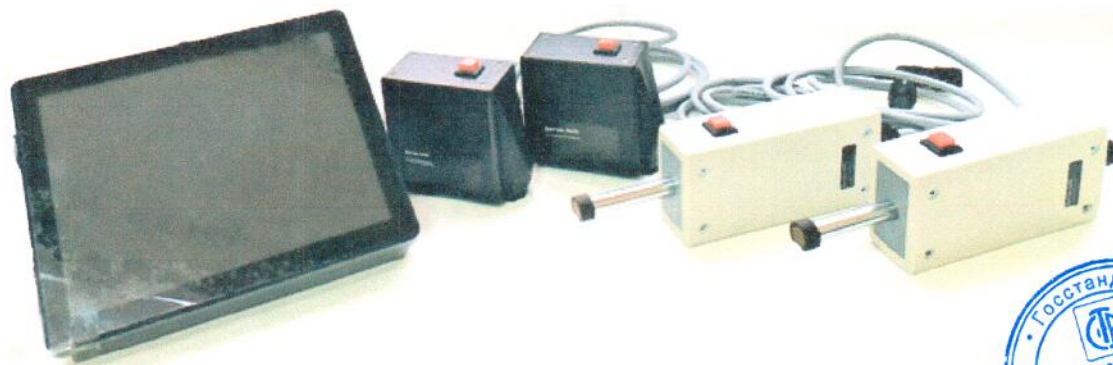
Рисунок 1 – Внешний вид комплекса НТ-800

Схема с указанием места для нанесения знака поверки в виде клейма-наклейки приведена в Приложении А.