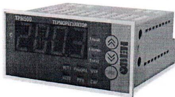
Рис.1 Общий вид приборов с одним цифровым индикатором

Фотографии общего вида приборов приведены на рисунках 1 и 2.