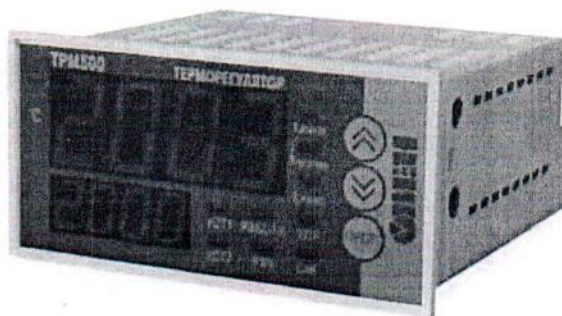
Рис.2 Общий вид приборов с двумя цифровыми индикаторами