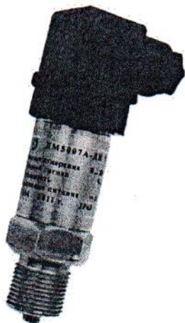
Рисунок 1 - Датчик давления ДМ5007А

Фотографии общего вида датчиков приведены на рисунках 1, 2 и 3.