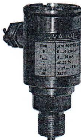
Рисунок 2 - Датчик давления ДМ5007Ех