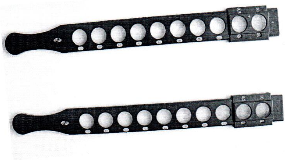
Рисунок 1- Внешний вид комплекта линеек скиаскопических ЛСК-1

Внешний вид линеек скиаскопических приведен на рисунках 1-2. Знак поверки наносится на инструкцию по применению.