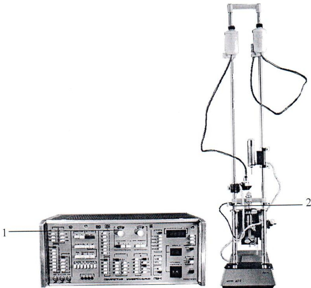
1 – измерительный блок; 2 – полярографический датчик ДП-2