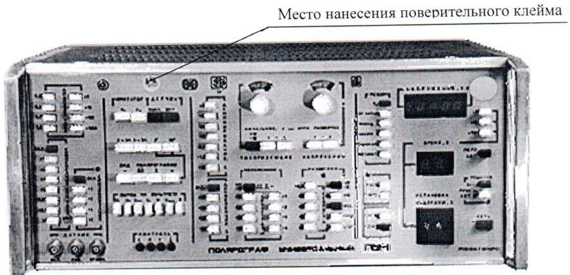
Рисунок А.1 – Схема нанесения на полярографы знака поверки

Схемы опломбирования от несанкционированного доступа и нанесения на полярографы знака поверки