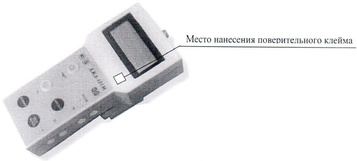
Рисунок А.1 – Схема нанесения на преобразователь знака поверки

Схемы опломбирования от несанкционированного доступа и нанесения на преобразователи знака поверки